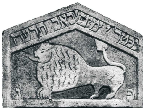
Lew, Lubaczów, 1915; fot. A. Trzciński, 1997

LAMPART – zawsze wraz z → jeleniem, → orłem i → lwem (reprezentując pożądane cechy człowieka wymienione w Pirke awot 5,23: „Bądź odważny jak lampart, lekki jak orzeł, szybki jak jeleni i silny jak lew – w spełnianiu woli twego Ojca, który jest w niebie”), od XIX w., motyw rzadki.