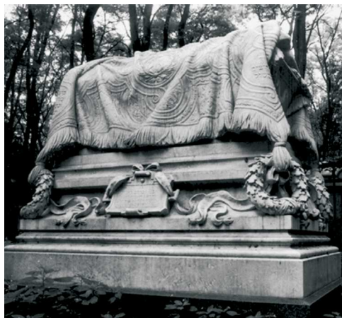
Trumna okryta całunem, Warszawa, 1889.

DRAPERIA – występuje w różnych kontekstach, funkcjach i rodzajach motywów. Poza rzeźbą kwalifikowaną precyzyjna identyfikacja motywu często nie jest możliwa. Niektóre z tych motywów pełnią jedynie funkcję kompozycyjno-dekoracyjną. 1. Banderola – motyw nawiązujący do dekoracyjnie ułożonej wstęgi, najczęściej umieszczany w zwieńczeniu i służący jako tło dla którejś z formuł inskrypcyjnych. Końce banderoli często zakończone są jakimś ornamentem (np. głowa zwierzęca, chwasty). Szczególnie popularna od XIX w., choć spotykana wcześniej. 2. Wstążka – zawsze towarzyszy innym motywom (np. przy girlandzie, wieńcu, koronie), od XVII w. 3. Zasłona (kotara) – jako dwa udrapowane płaty tkaniny; zawsze odsłonięta, podwieszona w zwieńczeniu steli lub jako obramowanie pola inskrypcyjnego; od XIX w. Mieści w sobie znaczenie tajemnicy i granicy pomiędzy światem doczesnym a przyszłym. 4. Lambrekin – od XVIII w., poziomy pas tka-