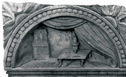
Zasłona, Warszawa, 1831

żydowskiej rozmaite znaczenia – m.in. symbolizują moc Boga jako stwórcy i władcy świata oraz jego boskie Prawo (Torę) będące światłem świata; także jaśniejące oblicza ludzi sprawiedliwych oraz boskie światła nieba i czasów mesjańskich. W kontekście egzystencji pojedynczego człowieka zachodzące słońce jest metaforą zmięczenia, zgaśnięcia życia.