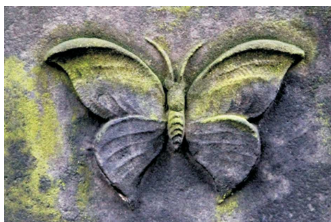
Motyl, Łódź, 1917; fot. A. Trzciński, 2016

LEW – w bardzo licznych kontekstach i wariantach: pojedynczo od XVI w., później też dwa lwy antytetycznie w funkcji adorantów lub strażników; leżący, stojący, wykonujący jakąś ludzką czynność (np. trzymający zwój Tory lub dzban, wrzucający monetę do puszeki, deptający węża, powalający łapą drzewo). Według słów Jakuba wygłoszonych do swych synów (Rdz 49,9) do lwa przyrównany został Juda. Lew jest też symbolem siły, potęgi – co według cytowanej sentencji ( Pirke awot 5,23) powinno być jedną z cech człowieka dążącego ku Bogu. Lew reprezentuje zatem cały naród żydowski, jak i pojedynczego człowieka. Związek zmarłego z przedstawieniem lwa na nagrobku powodowany bywa też znaczeniem imion – Jehuda oraz imionami znaczącymi Lew – hebrajskie Arje i jidyszowe Lejb.