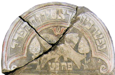
Ryby, Lublin, 1824; fot. A. Trzcziński, 2010

RYBA. Ryby małe – od XVI w., bez określonych cech gatunku (zwykle karpioвате), w różnych kontekstach i wariantach, najczęściej pojedynczo, także antytetycznie lub trzy przeplecione ze sobą. Ryby duże – od XVII w., przestylizowane, najczęściej przypominające delfina, także dwie w układzie antytetycznym, w obydwu przy-