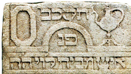
Dzban i misa lewitów, Krzeszów, 1762

skiej. Po upadku państwa i Świątyni – w liturgii synagogalnej – pozostałością ich dawnego statusu był przywilej obmywania rąk kapłanom (polanie wody z dzbana nad misą) przed błogosławieństwem kapłańskim. Niekiedy ukazana jest ręka trzymająca dzban, a poniżej dłoń kapłana.