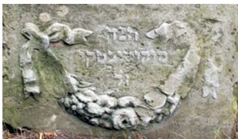
Girlanda, Zaklików, 1920; fot. A. Trzciński, 2011

GIRLANDA – półkolisty wieniec spleciony z liści, kwiatów i owoców, podwieszony po bokach. Jej wariantem jest feston – podobnie podwieszony pęk kwiatów lub kiść owoców. Występuje wyłącznie w rzeźbie kwalifikowanej. W XVII i XVIII w. motywy popularne na bokach skrzyń nagrobków tumbowych; na stelach, zwłaszcza w XIX w., nad lub pod polem inskrypcyjnym.