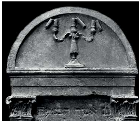
Złamana świeca, Warszawa, 1807; fot. A. Trzciński, 1994

STRZAŁA – przed XIX w. sporadycznie, w różnych kontekstach, niekiedy wraz z łukiem; reprezentuje przemianę, śmierć.