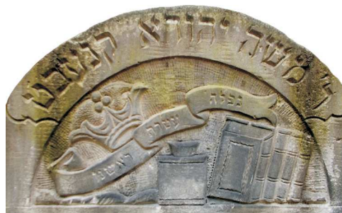
„Spadła korona naszej głowy” (Tr 5,16), Tomaszów Mazowiecki, ok. 1930; fot. A. Rybińska, 2015

KORONA – występuje w różnych kontekstach, posiada różne formy (co nie wpływa na znaczenie). Pojedynczo od pocz. XVII w., M. Od XIX w. także dwie lub trzy (niekiedy zaopatrzone w specjalną inskrypcję), M. Pojedyn-