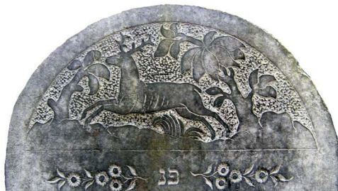
Jeleń, Warszawa, 1856

Jednorożec – zob. → zwierzęta fantastyczne.