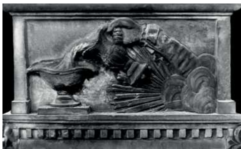
„Tak jak słońce zaszło, tak umarł chłopiec”, Warszawa, lata 1930.; fot. A. Trzciniński, 1994

CIAŁA NIEBIESKIE. 1. Gwiazda – konwencjonalna „gwiazdka” o różnej liczbie promieni, pojedynczo lub grupa gwiazd, co najmniej od końca XVII w. 2. Słońce – tarcza słońca w którymś punkcie drogi słonecznej, najczęściej na linii horyzontu, rzadziej w zenicie; od XIX w. 3. Księżyc – jednostkowe przypadki znane z terenów zachodniej Polski. Przedstawienia niebieskich ciał świetlnych – słońca, księżycy i konwencjonalnych gwiazdek mają w tradycji