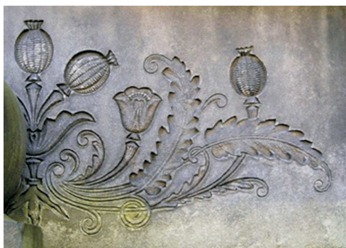
Makówki, Wrocław, po 1900; fot. A. Trzciniński, 2006

MAKÓWKA – motyw przejęty z otoczenia chrześcijańskiego, od XIX w., zwykle w dekoracyjnym układzie pęk makówek na łodygach; w środowisku asymilującym się.