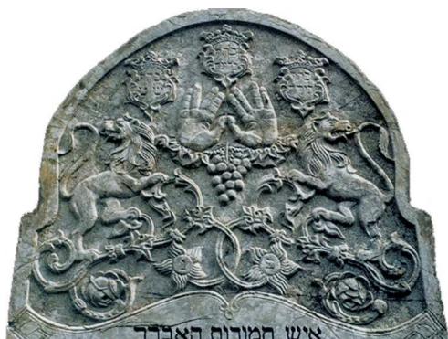
Dłonie w geście błogosławieństwa kaptarńskiego, Kraków, 1863

ZWÓJ TORY – od XIX w., w różnych kontekstach, MK; 1) zwinięty (zwykle ubrany w meil ) – w otwartej szafie, trzymany przez zwierzę, bez ściśle określonego związku; 2) rozwinięty ,