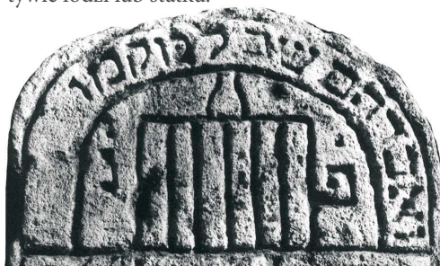
Sześć porządków Miszny, Frampol, 1892; fot. A. Trzciniński, 1996

KOTWICA – motyw przejęty z otoczenia chrześcijańskiego; od XIX w., mocno wyeksponowana wyłącznie w środowisku asymilującym się; ponadto jako element drugoplanowy przy motywie łodzi lub statku.