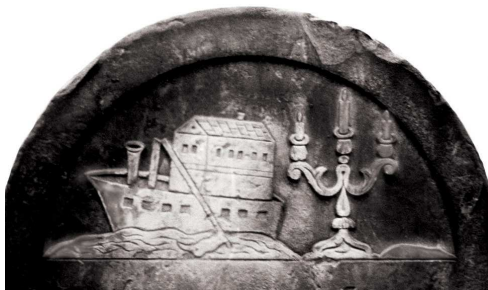
Łódź ze złamanym masztem, Łódź, 1895; fot. A. Trzciński, 1990

MENORA ŚWIĄTYNNA (tzn. siedmioramienna i występująca poza kontekstem lichtarża szabatowego) – spotykana sporadycznie, jedynie w środowisku postępowym; XX w., M lub nagrobki rodzinne.