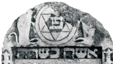
Magen Dawid, Frampol, 1763; fot. A. Trzcirski, 1996

TARCZA DAWIDA ( Magen Dawid , heksagram, popularnie: gwiazda Dawida) – występuje w bardzo różnych kontekstach, na nagrobkach w Europie i w Polsce stosowany był spo-