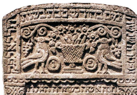
Ptaki adorujące drzewo życia, Oleszyce, 1871

PTAK. Ptaki małe – najczęściej bez określonych cech gatunku, w rzeźbie kwalifikowanej zwykle gołąb; w bardzo licznych kontekstach i wariantach, m.in. pojedynczo od XVI