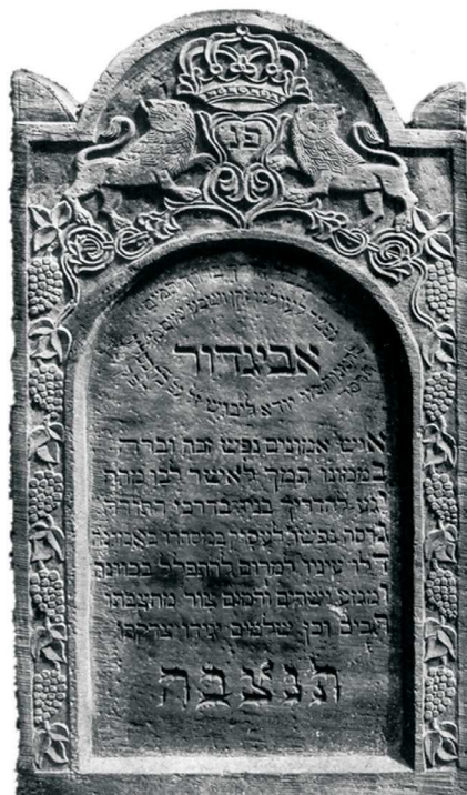
Winorośl, Ulanów, 1903; fot. A. Trzciniński, 2002

OWOC – pojedynczo lub na gałązce już od XVI w., od XVIII w. także owoce w wazie, rzadziej na drzewie; przeważnie nieokreślonego gatunku. Reprezentuje treści takie jak → drzewo, ponadto owocne życie oraz owoc „drzewa życia”, czyli nieśmiertelność duszy, nagrodę