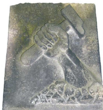
Młot, Warszawa, 1926; fot. A. Trzciński, 2006

MŁOT – zwykle trzymany w dłoni, tylko na nagrobkach członków partii Bund, od XX w.