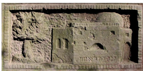
„Grób naszej pramatki Racheli”, Piaski, 1937

BUDOWLA – występuje w różnych kontekstach i rodzajach, od XIX w., m.in. 1. Dom mieszkalny , zwykle bliżej określony przez inskrypcję. 2. Synagoga lub bet ha-midrash – reprezentuje pobożność zmarłego. 3. Budowle z miejsc świętych w Palestynie, w tym nagrobki – pojawienie się tego motywu od schyłku XIX w. wiąże się z popularyzacją idei syjonizmu. 4. Widok miasta , niekiedy bliżej określony przez inskrypcję. 5. Zob. → nagrobek.