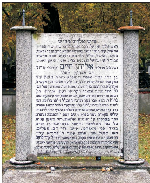
Nagrobek w formie zwoju Tory, Łódź, 1912; fot. A. Trzciński, 2016

Co najmniej od XVIII w. 2. Jako dekoracyjne zwieńczenie architektoniczne (zob. Elementy architektoniczne: → waza). 3. Waza płomienista (z wychodzącymi z niej płomieniami) – występuje jako osobna forma nagrobka, jako dekoracyjny naszczytnik, jako przedstawienie w polu przyczółka; od XIX w., w środowisku asymilującym się.