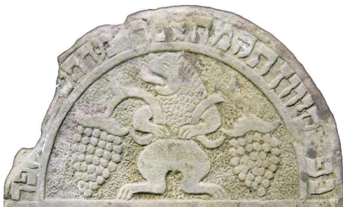
Niedźwiedź, Lublin, 1823; fot. A. Trzciński, 2010

NIEDŹWIEDŹ – od XVII w., występuje w trzech wariantach: 1) pojedynczy, w kontekście drzewa (obejmujący drzewo lub wić roślinną, stojący przy drzewie); 2) dwa niedźwiedzie niosące na drążku winne grono (popularny zwłaszcza na wschodnich obszarach); 3) na łańcuchu. MK. Symbolizuje dążenie człowieka do zdobycia słodczy nauki Tory, tak jak niedźwiedź trzusi się, wchodząc na drzewo, by zdobyć słodki miód z gniazda pszczół. Związek zmarłego z przedstawieniem niedźwiedzia na nagrobku powodowany bywa też imionami znaczącym Niedźwiedź – hebrajskim Dow i jidyszowym Ber.