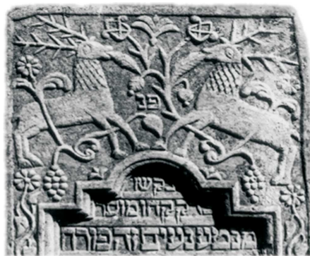
Jelenie spożywające z drzewa życia, Lubaczów, 1847; fot. A. Trzciński, 1997

cie formalnym drzewo w całej postaci, ukazane z większą lub mniejszą dozą realizmu, lecz przeważnie nieokreślonego bliżej gatunku, występuje dopiero od XIX w. W przedstawieniach o silniejszej tendencji realistycznej rozpoznać można palmę, dąb, wierzbę płaczącą, drzewa owocowe (obwieszane owocami, sporadycznie o dającym się rozpoznać gatunku), drzewa iglaste (ukazane bardzo umownie), a także krzewy (zwłaszcza róży i bluszczu). Równolegle przedstawiana bywa sama gałąź wymienianych drzew; w rzeźbie kwalifikowanej najbardziej popularny jest konwencjonalny motyw gałązki palmy lub dębu. Przed XIX w., a w rzeźbie ludowej zawsze (lecz nie wyłącznie), całe drzewo reprezentowane jest przez typowy motyw „drzewa życia” – stylizowaną wic roślinną lub kwiat, wyrastające z wazy albo z ziemi. Od XIX w. pojawiają się warianty wanitatywne: drzewo złamane (lub ze złamaną gałęzią), uschnięte, ścięte; sama gałąź złamana albo uschnięta, spadający owoc.