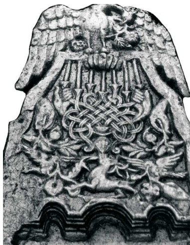
Lichtarż szabatowy, Baligród, 1902; fot. A. Trzciński, 1987

się dopiero u schyłku XVIII w. i szybko zyskały dużą popularność – przez co można łatwo rozpoznać na cmentarzu kwatery kobiet. Poprzez złamaną lub zgaszoną świecę wprowadzono treści dotyczące przemijania i śmierci. Lichtarż z świecą , zwykle obok książki, od XIX w., M, sporadycznie K. Na nagrobkach mężczyźni lichtarż, zwykle pojedynczy, ukazany bywa w kontekście książek – jako sprzęt dający oświetlenie podczas studiowania świętych ksiąg, na co przeznaczano czas zwykle nocą, po całym dniu pracy.