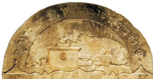
Puszka na datki: „Dar w skrytości dany uśmierza gniew” (Prz 21,14), Suwałki, 1897; fot. A. Trzciński, 2006

PUSZKA OFIARNA – od XIX w., w różnych kontekstach, niekiedy opatrzona inskrypcją, KM. Reprezentuje dobroczynność jako jedną z trzech rzeczy – w tradycji żydowskiej – na których opiera się świat ( Pirke awot 1,2). Istnieje wiele sentencji dotyczących dobroczynności, m.in. „Dobroczynność ratuje od śmierci” (Prz 10,2) – stąd stosunkowo często manifesto-