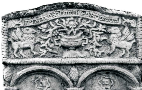
Gryfy adorujące drzewo życia, Sieniawa, 1858; fot. A. Trzcziński, 1984

ZWIERZĘTA FANTASTYCZNE. Gryf (ciało lwa, głowa i skrzydła drapieżnego ptaka) – zwykle dwa gryfy antytetycznie w funkcji strażników lub adorantów, kojarzone są z biblijnymi cherubami; szczegółowe intencje znaczeniowe niejasne. Jednorożec – w różnych kontekstach i wariantach: pojedynczo – stojący lub leżący; dwa jednorożce antytetycznie w funkcji adorantów lub strażników, antytetycznie z lwem. W tradycji żydowskiej symbolizuje doskonalenie duszy przez studia religijne, pozytywne cechy zmarłego oraz czasy mesjańskie. Lewiatan – zwykle jako ryba zwinięta w okrąg, od XVIII w., repre-