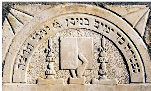
Modlitewnik dla kobiet, Sandomierz, 1935

KSIĄŻKA – występuje od XIX w. w licznych kontekstach i wariantach, nierzadko opatrzona identyfikującą ją inskrypcją (tytuł lub cytat); m.in. pojedyncza (zamknięta lub otwarta), szereg książek, stos książek (rzadko); umieszczone w szafie, na stole, bez sprecyzowanego miejsca, książka trzymana w dłoni lub przez zwierzę. Książka – motyw bardzo popularny na nagrobkach mężczyzn, jako tych, których obowiązuje religijny nakaz studiowania Tory i Talmudu. Książki na nagrobkach – przedstawiane pojedynczo, po kilka lub wypełniające półki szafy bibliotecznej – to przede wszystkim tomy literatury religijnej, niekiedy opatrzone tytułami, np.