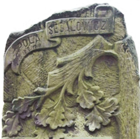
Złamane drzewo, Łódź, 1917; fot. A. Trzciński, 2016

DRZEWO – w aspekcie ideowym, symbolicznym obejmuje bardzo szeroki zakres motywów; w zasadzie wszystkie formy roślinne. W aspek-