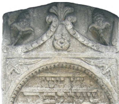
Rozeta, palmeta i kampanula, Kraków, 1615

ROZETA – motyw o dośrodkowo ułożonych elementach, przypominający rozłożony kwiat. W zależności od kształtu i stopnia stylizacji elementów można podzielić rozety na roślinne (liściaste lub kwiatowe) i geometryczne (o płatkach lancetowatych oraz wirowe – o płatkach z linii falistych). Nieprzerwanie popularne od XVI w. W rzeźbie kwalifikowanej przeważają formy roślinne. Na terenach południowych,