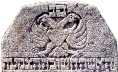
Orzeł, Krzeszów, 1745

ORZEŁ – jednogłowy lub dwugłowy – zazwyczaj w pozie frontalnej, z rozpostartymi skrzydłami, od XVII w. Orzeł jednogłowy w różnych kontekstach i pozach, także w zespole z lwem, jeleniem i lampartem; od XIX w. Już od czasów biblijnych reprezentuje przede wszystkim takie cechy, jak potęga oraz opieka Boga nad człowiekiem (np. Wj 19,4; Pwt 32,11). Być może oznacza też troskę i opiekę, jaką zmarły sprawował za życia nad rodziną. Ponadto orzeł wyraża jeden z przymiotów człowieka – lekki jak orzeł – postulowanych w sentencjach ojców