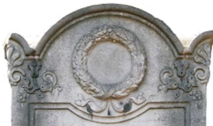
Wieniec, palmeta i kampanula, Warszawa, 1819

KAMPANULA – ornament w formie mocno przestylizowanego kwiatu dzwonka w ujęciu profilowym. W zdobnictwie macew popularny od XVII w. jako wypełniacz narożników (pojedynczo), a w układzie pasowym do brzeżenia pól.