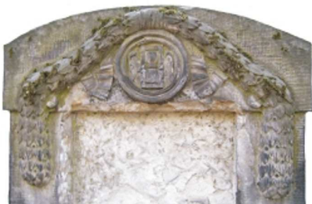
Feston, Warszawa, lata 1920.-1930.

ARABESKA – ornament oparty na faliście biegnącej łodydze wici roślinnej z rozgałęzieniami zakomponowanymi w łuki, spirale, woluty. Występuje od XVII w., głównie w rzeźbie kwalifikowanej, w układzie pasowym wokół pól lub zamknięta jest w prostokącie stojącym albo leżącym; niekiedy wyrasta z wazy lub z kosza. Na stelach stosowana w bordiurach i fryzach lub centralnie w polu przyczołka.